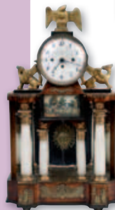
Portaluhr - Empire