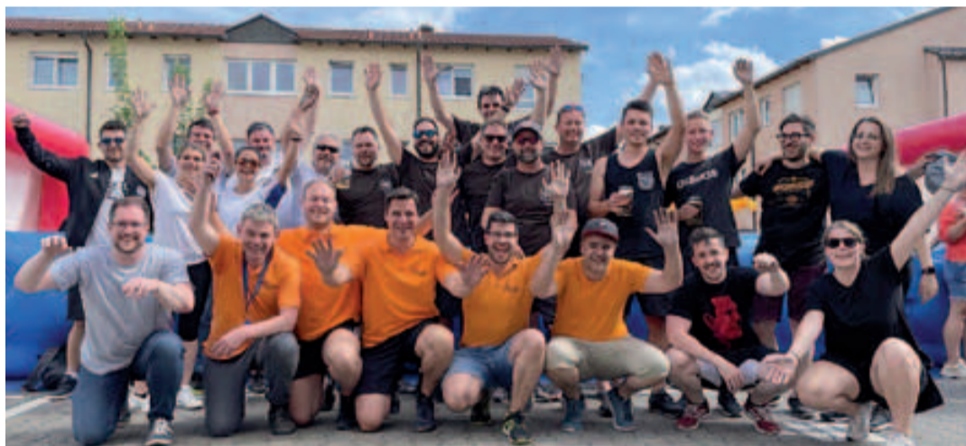
Die Mannschaften auf dem Gruppenbild von links nach rechts: Himmelgarten Runners, 1. FC Röttenbach, Seidlas Connection, Freie Wähler (vorne).