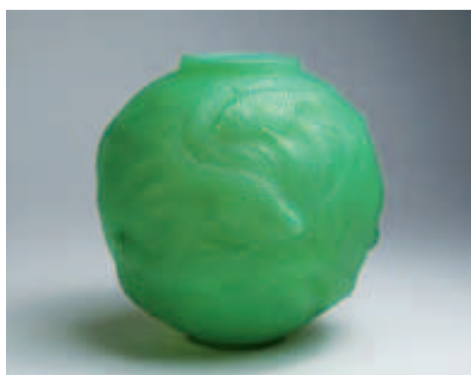
Kugelvase „Formose“ von René Lalique

Aber auch bei Porzellan, Skulpturen und Silber sind hochkarätige und dekorative Gegenstände zu finden. Den Abschluss am Samstag, den 23. Juli, bilden Möbel und Lampen vom Barock über Biedermeier bis hin zum modernen Design. Dazu gehört eine stilvolle Vitrine, der Biedermeier Epoche um 1820/1825 aus dem süddeutschen Raum, furniert mit Nussbaum auf Nadelholz.