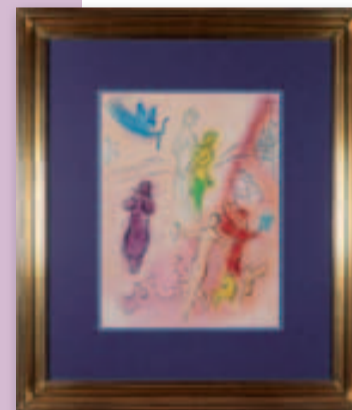
Marc Chagall „Das Märchen von Syrinx“