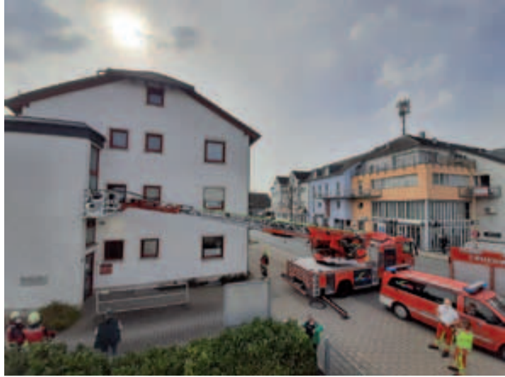
Einsatz Nr. 37/2022 - 17.03.2022 - 13:00 Uhr THL Ukraine-Hilfe; Lauf an der Pegnitz Fahrzeuge: MTW, MZF, GW Logistik Dauer: 6,0 h

Zusammen mit den Feuerwehren aus Lauf, Heuchling, Behringsdorf und den Kameradinnen und Kameraden vom THW Lauf, haben wir im Rahmen eines Hilfeleistungseinsatzes eine ehemalige Sporthalle im Laufer Industriegebiet für die Ankunft von Kriegsflüchtlingen aus der Ukraine vorbereitet. Vorerst können in der Halle 120 Personen, später bis zu 240 Hilfesuchende untergebracht werden. Dank an alle, die so kurzfristig bereit waren mitzuwirken, wir sind stolz auf die große Hilfsbereitschaft in unserem Land.