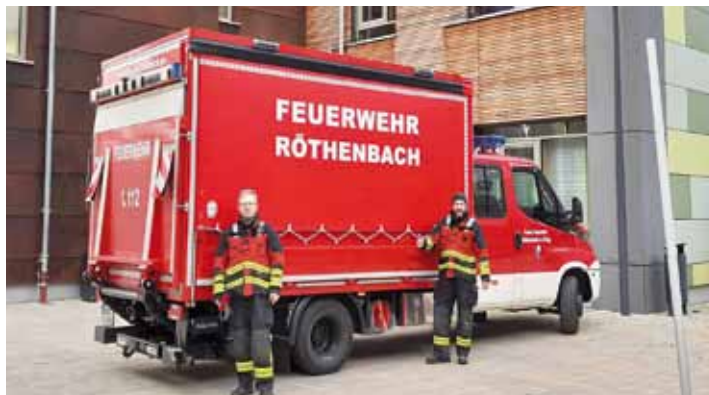
Die ersten beiden Einsätze im Jahr 2022 waren durch die Corona-Pandemie geprägt. Im Rahmen des Katastropheneinsatzes bezüglich COVID 19 waren wir am Freitag, den 07.01.2022 und am Montag, den 10.01.2022 mit unserem GW Logistik unterwegs, um an Schulen im Landkreis die benötigten Coronatests zu verteilen.