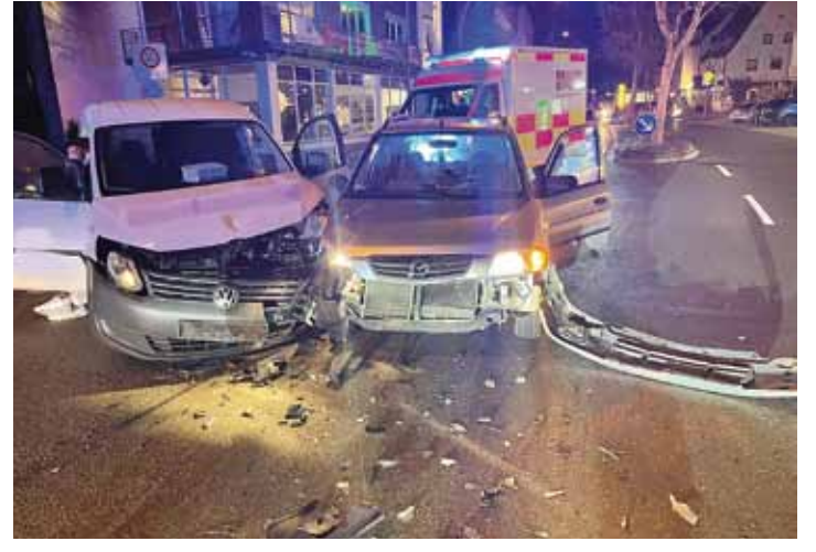
Einsatz Nr. 5/2022 - 13.01.2022 18:43 Uhr Verkehrsunfall PKW Rückersdorfer Str. Fahrzeuge: MTW, LF 16/12, RW, GW Logistik Verkehrsunfall zwischen zwei PKW am Abend des 13.01.2022 in der Rückersdorfer Str., eine Person wurde leicht verletzt, wir nahmen ausgelaufene Betriebsmittel auf, stellten den Brandschutz sicher und übernahmen die Verkehrslenkung.