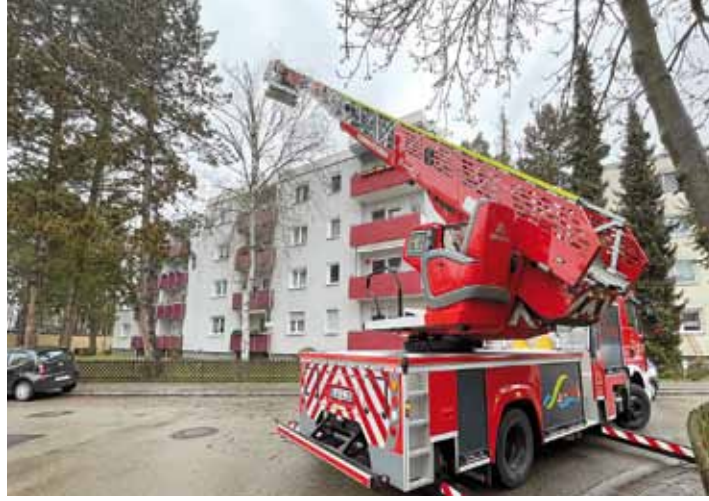
Einsatz Nr. 177/2021 - 29.12.2021 11:45 Uhr Äste drohen zu fallen Tannenstr., Röthenbach/Peg.