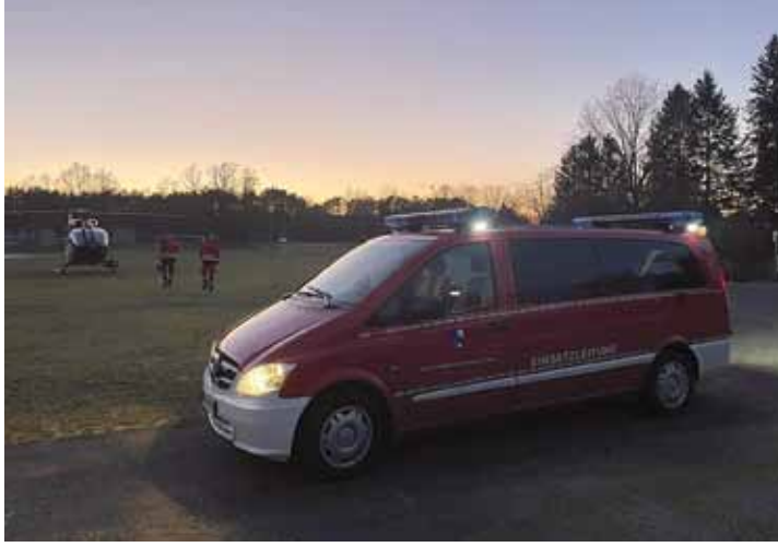
Einsatz Nr. 172/2021 - 21.12.2021 15:58 Uhr Unterstützung Rettungsdienst-Notararztzubringer Randstr. Fahrzeuge: MTW, LF 16/12, DLK 23/12 - Dauer: 1,0 h