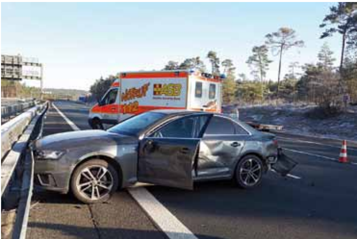
Bei strahlendem Sonnenschein waren auf der A9 in Richtung Berlin im Einsatz. An der Fahrbahn-Zusammenführung von A3 und A9 kam es zur Kollision zwischen einem PKW und einem LKW, verletzt wurde glücklicherweise niemand. Wir stellten den Brandschutz sicher, beseitigten die Unfallspuren und sorgten für die Verkehrslenkung.