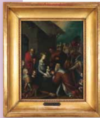
Frans Francken Anbetung der Hirten