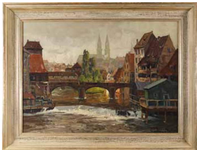
Ölgemälde von Erich Mercker „Partie an der Pegnitz“. Altstadtansicht am Pegnitzwehr mit Maxbrücke in Nürnberg.

Die Auktion findet, wie bereits bestens bewährt, ausschließlich online statt. Bieter können sich entweder über unsere Website www.auktionshaus-franke.de registrieren und ihre Gebote abgeben oder über eine andere Plattform live mitbieten und die Versteigerung verfolgen. Der ausführliche bebilderte Katalog ist ab Weihnachten online abrufbar.