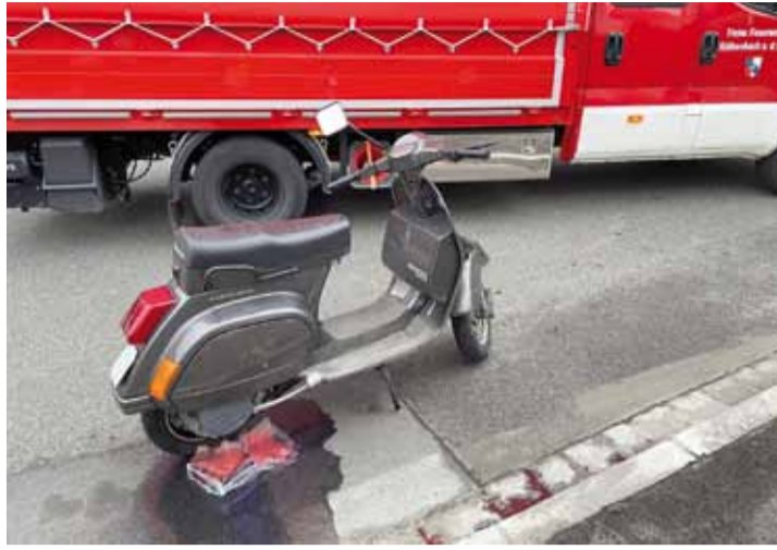
„Großeinsatz“ in Röthenbach Einsatz Nr. 157/2021- 20.11.2021 13:37 Uhr Öl aus Roller, Schönberger Str., Röthenbach/Peg. Fahrzeuge: MTW, GW Logistik - Dauer: 0,5 h