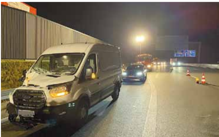
Verkehrsunfall Transporter/LKW BAB A3 Richtung WÜ Fahrzeuge: MTW, LF 16/12, RW, LF 20 KatS mit VSA Dauer: 2,0 h