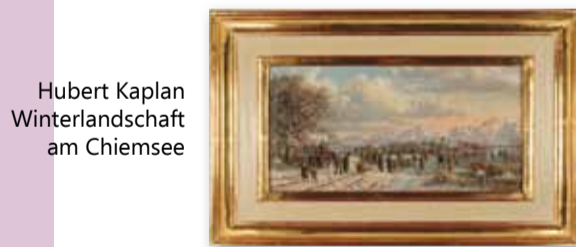
Hubert Kaplan Winterlandschaft am Chiemsee