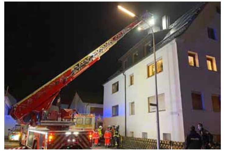
Einsatz Nr. 169/2021 - 17.12.2021 19:26 Uhr ABC-Alarm CO-Austritt Leinburg Fahrzeuge: MTW, LF 16/12, DLK 23/12, RW - Dauer: 2,0 h