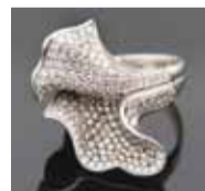
Damenring mit Brillanten