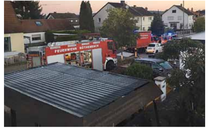
Einsatz Nr. 135/2021- 10.10.2021 7:06 Uhr Keller unter Wasser Kleingartenstr., Röthenbach MTW, LF 16/12, RW, GW Logistik Einsatzdauer: 3,0 h

Eine unangenehme Überraschung erwartete die Bewohner eines Hauses in der Kleingartenstraße am frühen Sonntagmorgen. Durch einen Defekt an der Wasserversorgungsinstallation stand der komplette Keller ca. 15 cm unter Wasser.