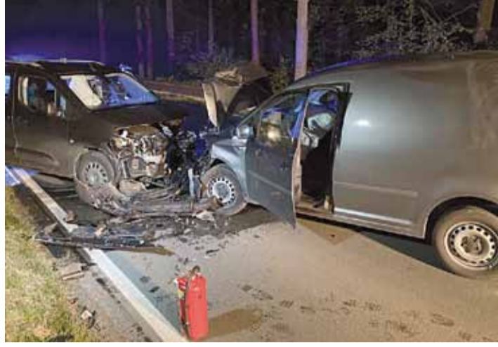
Einsatz Nr. 130/2021 - 25.09.2021 9:57 Uhr Verkehrsunfall PKW BAB A9