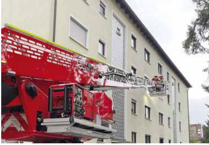
Einsatz Nr. 112/2021 - 18.08.2021 17:09 Uhr Wohnungsöffnung akut, Grabenstr., Röthenbach/Peg. MTW, LF 16/12, DLK 23/12, RW Einsatzdauer: 0,5 h