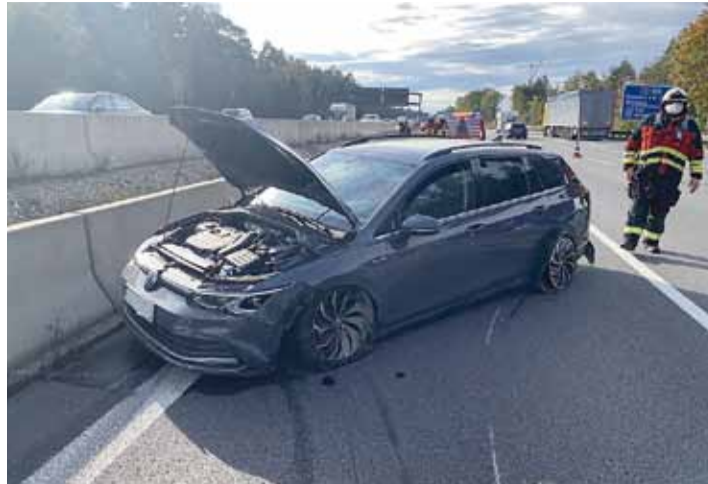
Einsatz Nr. 141/2021 15.10.2021 14:52 Uhr Verkehrsunfall PKW BAB A 3 -> Würzburg Fahrzeuge: MTW, LF 16/12, RW, GW Logistik Feuerwehr Schwaig mit GW Logistik + VSA