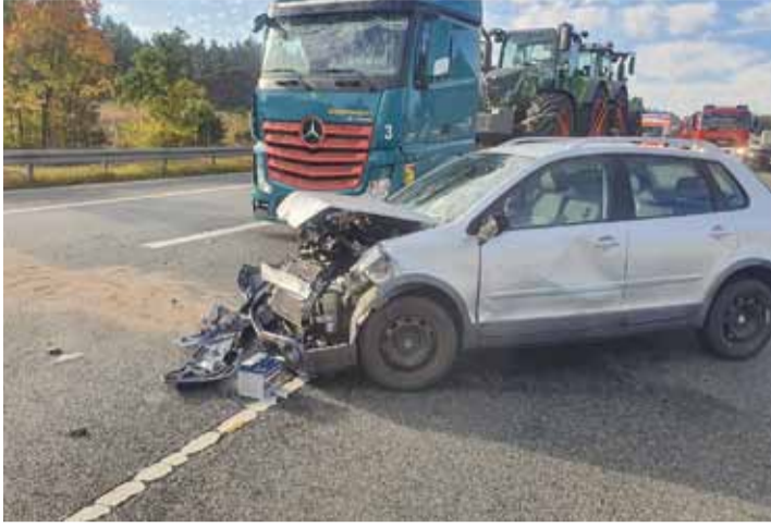
Einsatz Nr. 140/2021 15.10.2021 9:05 Uhr Verkehrsunfall PKW/LKW BAB A 9 -> Berlin Fahrzeuge: MTW, MZF, LF 16/12, RW, GW Logistik, LF 20 KatS mit VSA