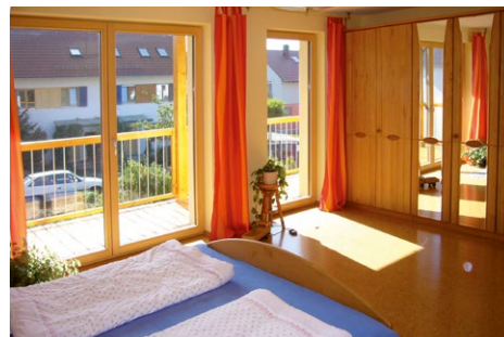
Die Sonne liefert Energie kostenlos – Energiesparfenster mit 3 Scheiben halten die Wärme im Haus.

Achten Sie neben den Eigenschaften der Fenster auch auf folgende Aspekte: