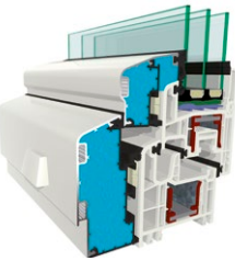
Wärme gedämmter Fensterrahmen