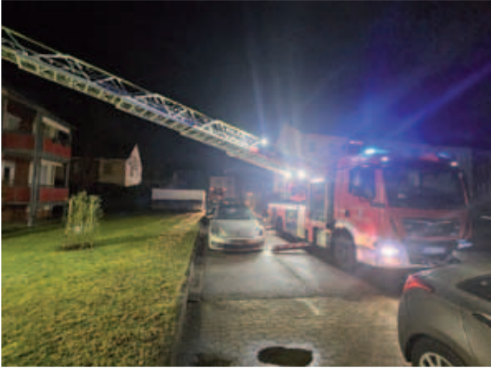
Einsatz Nr. 15/2024 - 25.02.2024 1:03 Uhr Bild oben THL Wohnung öffnen akut Donauschwabenstr., Röthenbach Fahrzeuge: MTW, DLK 23/12, RW